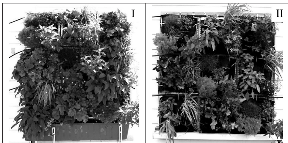
Fot. 2. Rozwój roślin na modelach doświadczalnych zielonych ścian po dwóch sezonach wegetacyjnych; model retencyjny (I) – pokrycie 90%, sierpień 2012 (znaczny przyrost biomasy) oraz model ekonomiczny (II) – pokrycie 60%, sierpień 2012 (znikomy wzrost roślin)

W doświadczeniu zaobserwowano, iż najważniejszym czynnikiem wpływającym na prawidłowy rozwój roślin na modułowych zielonych ścianach jest zapewnienie roślinności właściwej niezbędnej ilości wody. Model retencyjny (I) z zastosowanym substratem glebowym zapewniał prawidłowe warunki wodno-powietrzne do rozwoju roślin. W modelu ekonomicznym (II) zaobserwowano brak wystarczającej ilości wody i składników mineralnych, co było przyczyną powolnego przyrostu biomasy roślin oraz słabego pokrycia elewacji liśćmi.