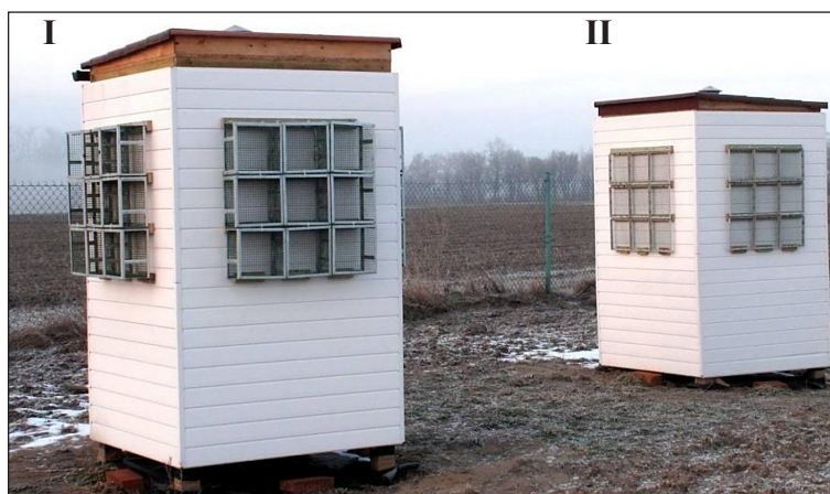
Fot. 1. Modele doświadczalne modułowych zielonych ścian (model retencyjny I, model ekonomiczny II)

Konstrukcja pionowego ogrodu składającą się z wolnostojących obiektów doświadczalnych wykonanych w formie domków drewnianych o wymiarach 1,5×1,5×2,5 m (dł.×sze.×wys.) oraz paneli roślinnych (fot. 1). Każda z elewacji została wyposażona w 9 paneli o wymiarach 33×33 cm (dł.×szer.). Powierzchnia