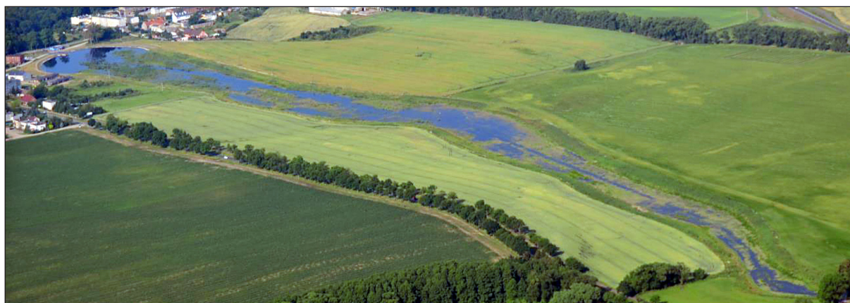
Rys. 2. Zarastanie zbiornika Przebędowo Fig. 2. Overgrowth of the Przebędowo reservoir