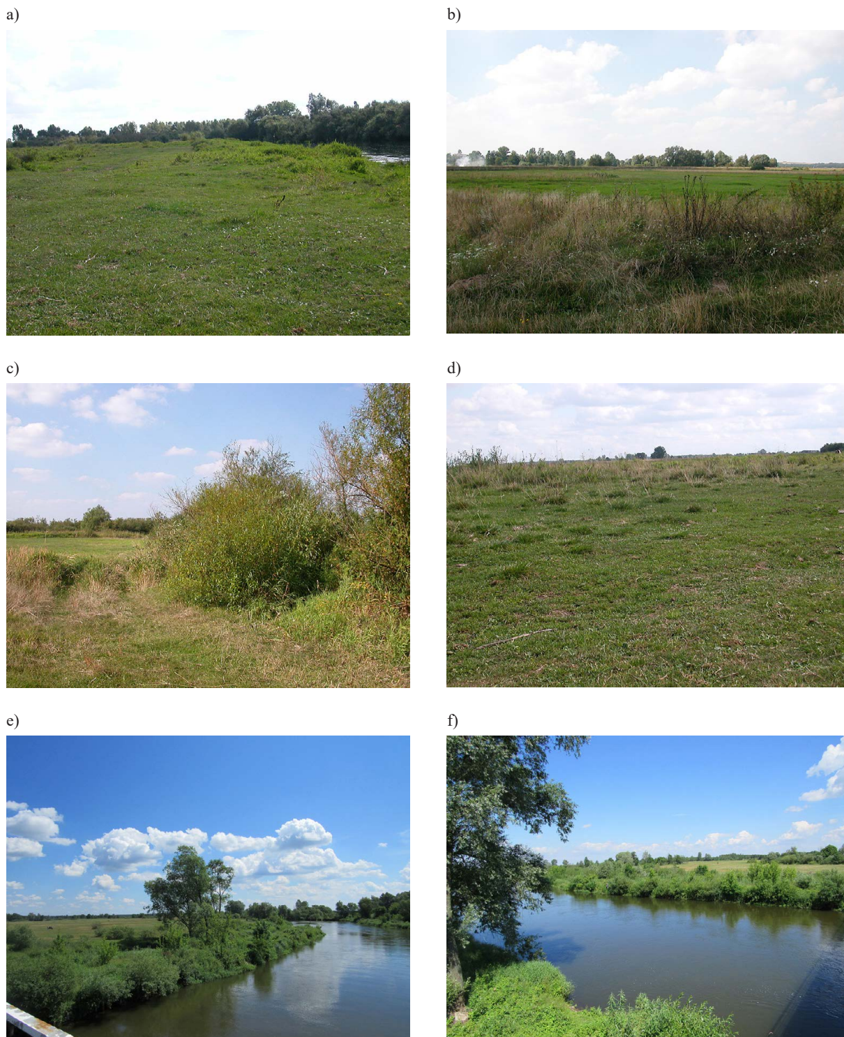
Rys. 2. Przykłady pastwiskowego wykorzystania terenów zalewowych – pastwisko w latach a), b) -2004, c), d)-2006, e), f)-2016