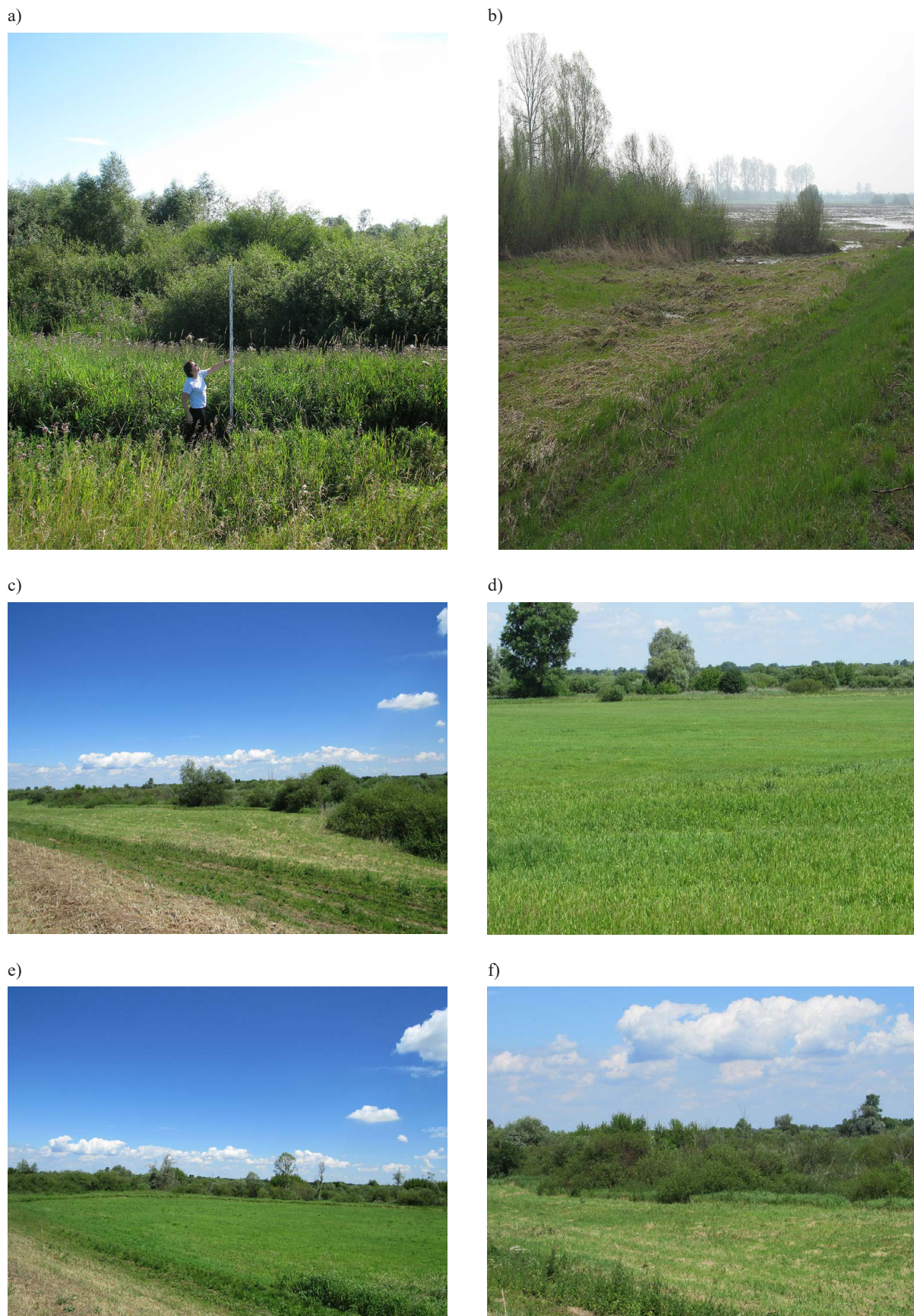
Rys. 3. Tereny zalewowe rzeki Warty, powyżej zbiornika Jeziorsko – łąka a) 2004 rok, b) 2006 rok, c) d), e), f) 2016 rok